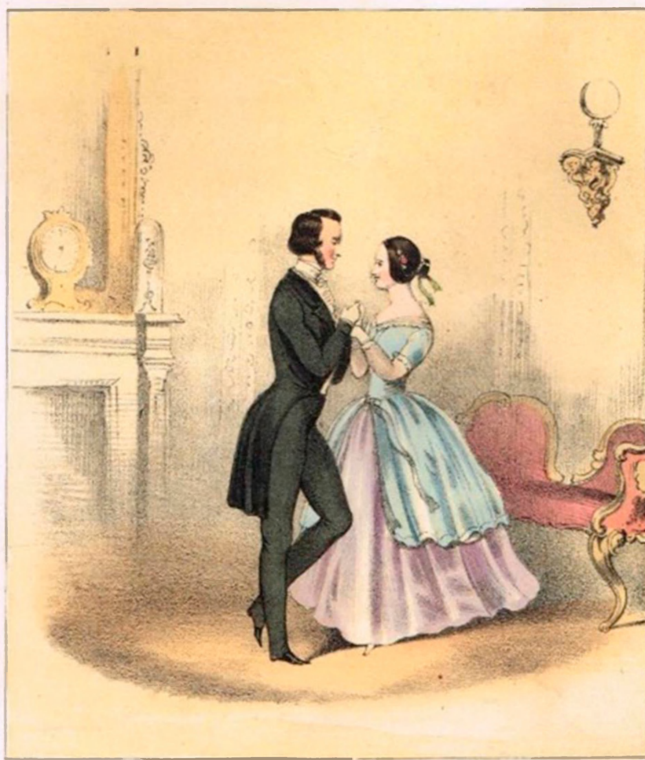
With the heel and toe step Valse up and down passing your lady over from your left arm to your right & from your right to your left alternately.