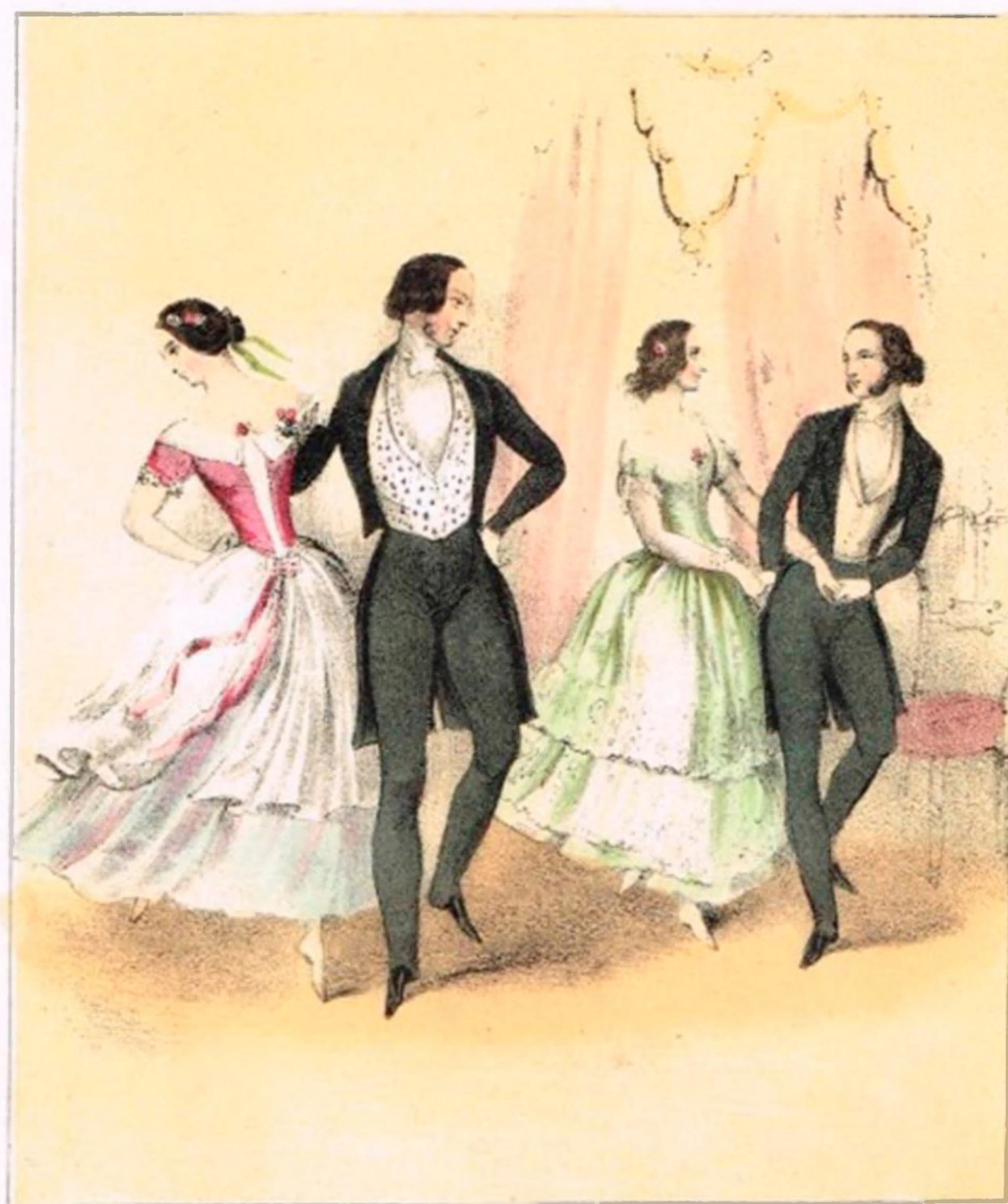
Advance together down centre of the ball room doing figure ine step and then do the gallop step round to the commencing point.