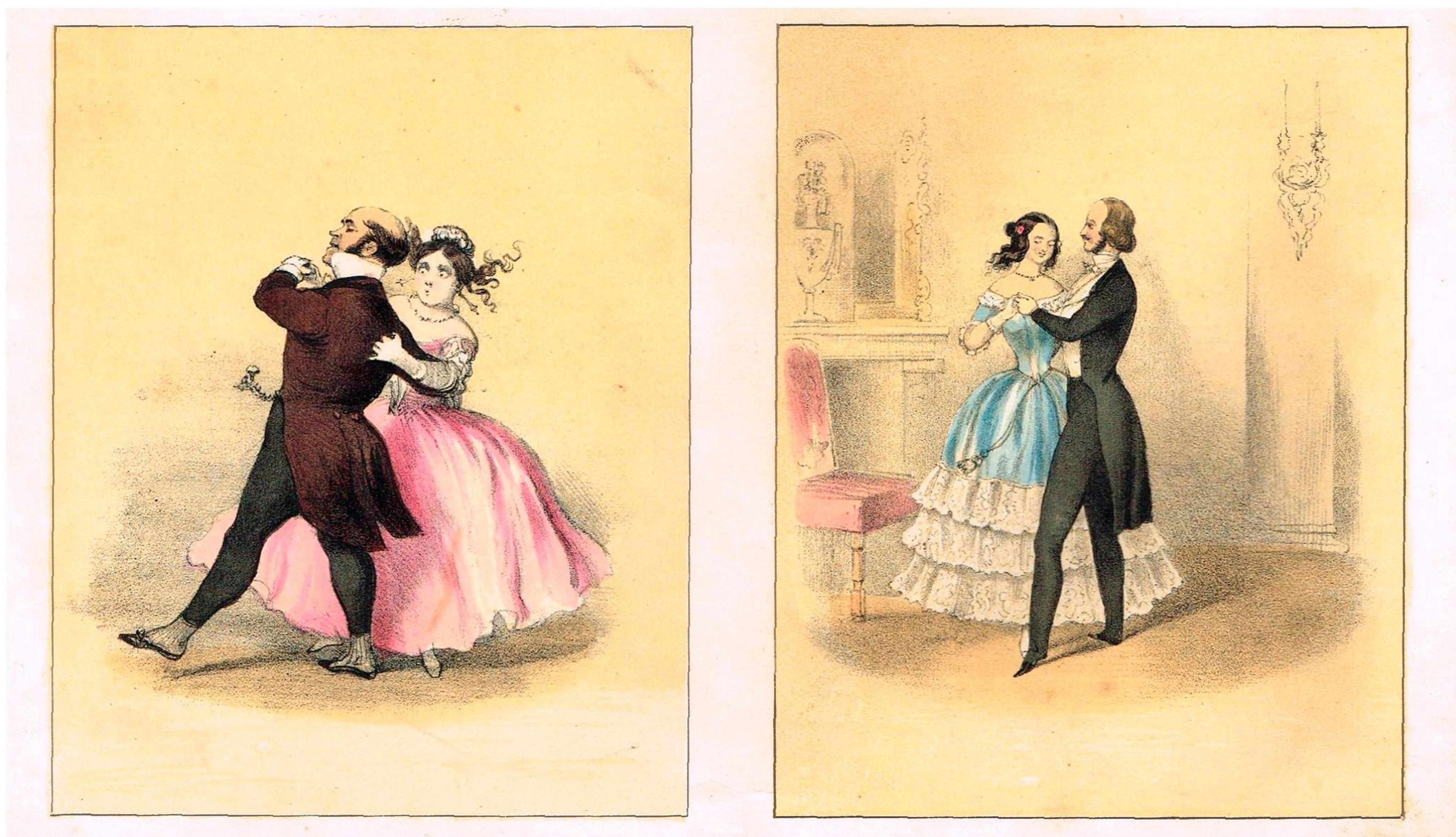
Valse round the room, doing the back step, turning your partner the contrary way to the usual Valse.