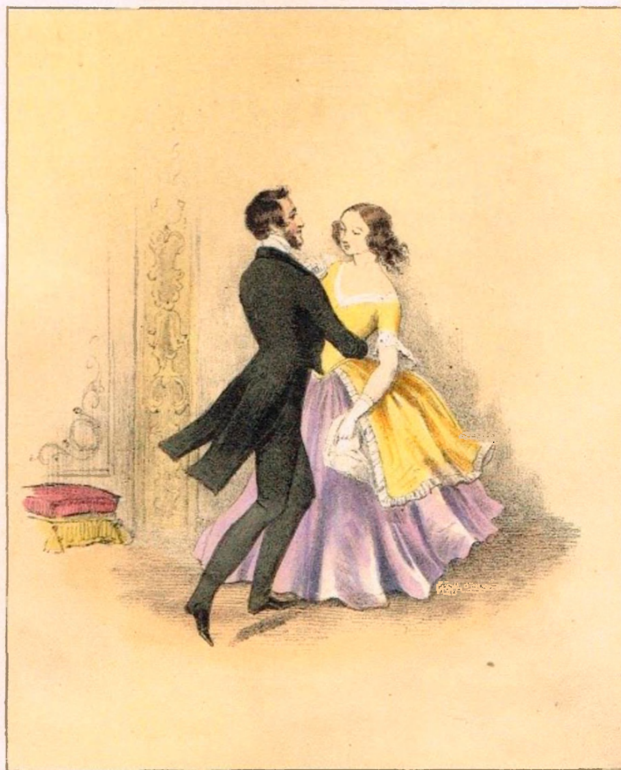
With the heel and toe step Valse up and down passing your lady over from your left arm to your right & from your right to your left alternately.